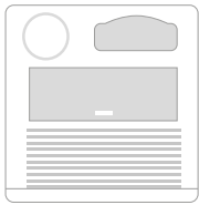
Top Mod. 7-10-10C

Motore ventilazione frontale / Front ventilation motor Moteur de ventilation frontal / Motor für die Frontbelüftung Motor de ventilación frontal / Motor de ventilação frontal