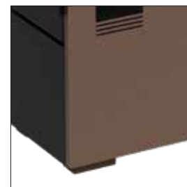
Piedini in legno / Wooden feet Pieds en bois / Holzfüße Pies de madera / Pés de madeira