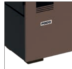
Piedini in legno / Wooden feet Pieds en bois / Holzfüße Pies de madera / Pés de madeira